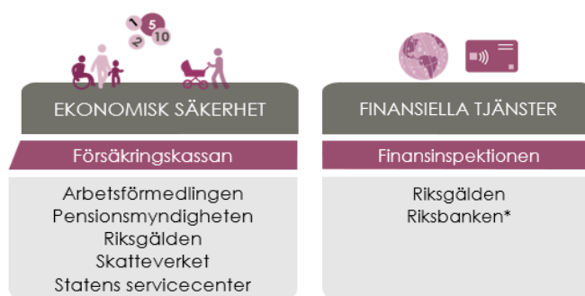
Figur 2: Illustrationen visar beredskapssektorer aktuella för finansiell sektor. Överst finns respektive beredskapssektor, följt av sektorsansvarig myndighet, följt av beredskapsansvarig myndighet. I respektive beredskapssektor ingår även privata aktörer, ej illustrerade i denna figur. (MSB: 2023).

Vidare startade regeringen under våren 2023 det tvärssektoriella näringslivsrådet för totalförsvar och krisberedskap. Rådet är ett