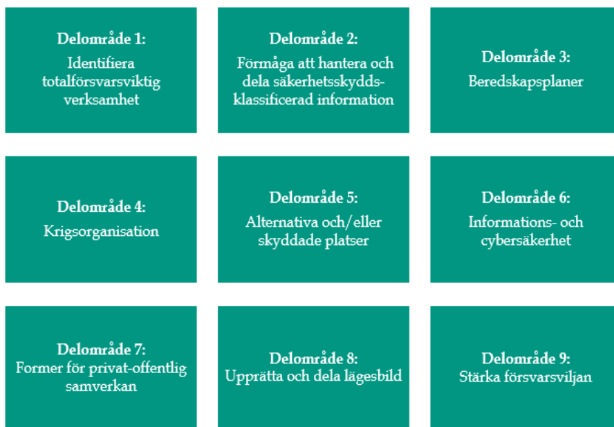
Figur 3: Beskrivning av de delområden som har identifierats i FSPOS handlingsplan för civilt försvar.

Handlingsplanen kan ses som en utgångspunkt för civil beredskap då denna har bäring på båda områdena civilt försvar och krisberedskap. Delområde 1, identifiering av totalförsvarsviktig verksamhet, berör även identifiering av samhällsviktig verksamhet, då det begrepp som numera används av MSB är samhällsviktig verksamhet av betydelse för totalförsvaret . 11